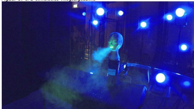
Figuur 2: DNW visualisaties aerosolen

Resultaat: met metingen uitgebreide simulatiemodellen voor de bepaling van de besmettingsrisico's van SARS-CoV-2 aan boord van vliegtuigen.